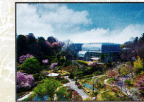
五台山展望台・竹林寺・牧野植物園